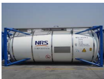
UN タンクコンテナ (T11)