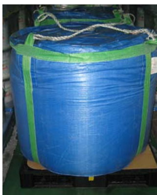
プラスチック製袋 (5H1)