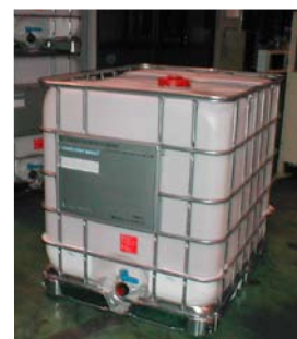
プラスチック製 IBC 容器 (IBC02)