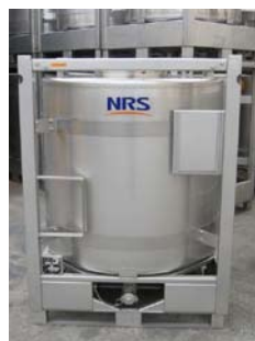
金属製 IBC 容器 (IBC08)