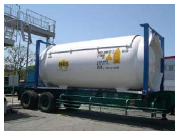
高圧ガスタンクコンテナ (T50)